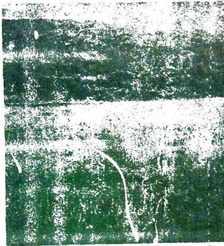
Sl. 5. Sasovina zajednice Limonio-Artemisietum caerulescentis .

Gris., Hordeum maritimum With., Lepturus incurvatus Trin. Plantago maritima L. i redne vrste Artemisia caerulescens L. koja je optimalno razvijena na manje slanim i nikad plimom plavljenim površinama, gde gradi posebnu zajednicu o kojoj će dalje biti reči. Ova varijanta predstavlja intermedijerni stupanj između zajednice Arthrocnemum fruticosi i zajednice halofitskih pašnjaka Limonio-Artemisietum caerulescentis H-ić.