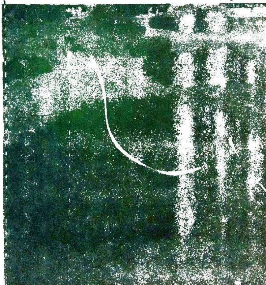
Sl. 2. Grupa individua vrste Arthrocnemum fruticosum u isušenim basenima solane.

Od pratilica zajednice Salicornietum herbaceae značajno je prisustvo vrsta iz sveze Arthrocnemion fruticosi i to: Arthrocnemum fruticosum (L.) Moq., Limonium angustifolium (Tausch) Deg. i Puccinellia festuciformis Parl. U vrlo retkim slučajevima susrećemo vrstu Inula crithmoides L. koja je uglavnom vezana za zajednicu sa žbunastom caklenjačom ( Arthrocnemum fruticosum L. Moq.).