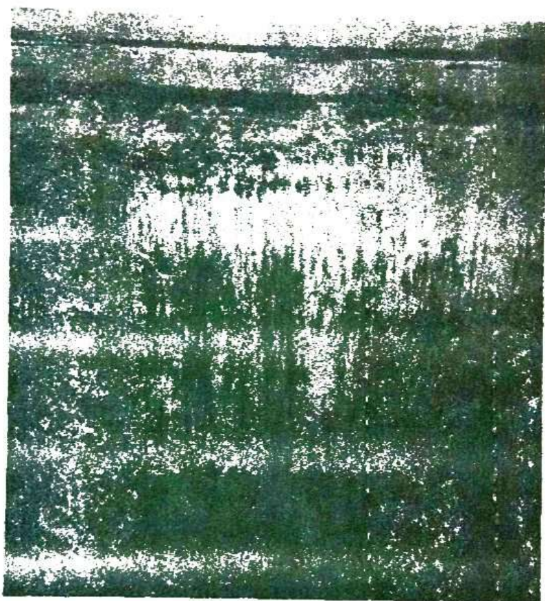
Sl. 1. Deo sastojine zajednice Salicornietum herbaceae u stalno plavljenim basenima solane. U plitkoj vodi obilno zastupljena vrsta Ruppia maritima .

Vegetacija sa zeljastom caklenjačom donekle je pionirskog karaktera, i razvija se na jako slanim i stalno plavljenim mestima, a vrlo često pojedine sastojine ove zajednice nalaze se u toku cele vegetacijske periode delimično potopljene u plitkoj vodi, te na taj način imaju emerzni karakter. Površine na kojima se javlja ova zajednica najčešće su unutrašnji (centralni) delovi basena donje solane, ivice kanala za dovod morske vode i plitke plavne obale mora. U edafskom pogledu nastanjuje muljevito-glinovite supstrate bogate natrijum hloridom i sumpor-vodonikom.