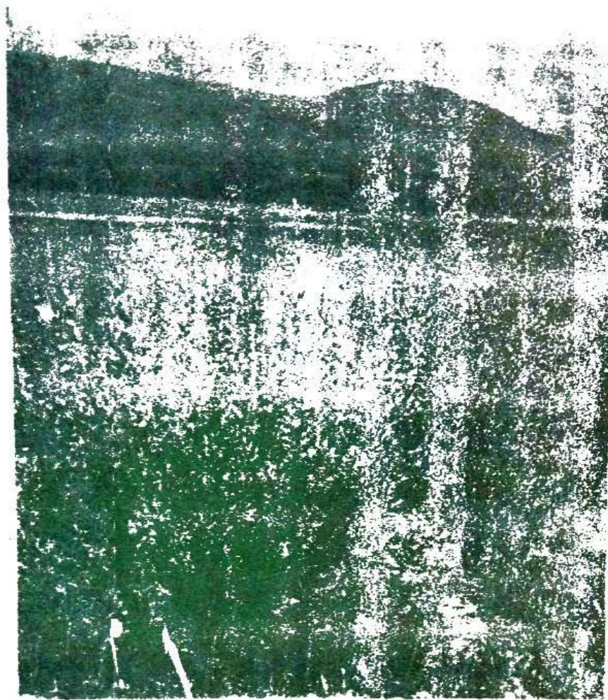
Sl. 6. Primerci vrste Artemisia caerulescens . Fig. 6. The specimens of the species Artemisia caerulescens .

tom caklenjaćom. Podloga na kojoj se javlja ova subasocijacija je muljevita, slična kao i u prethodnim zajednicama, ali daleko manje bogata natrijum-hloridom, s obzirom da ovi baseni nemaju direktnu vezu sa morem, već preko malih, daleko već potpuno vegetacijom obraslih i skoro nefunkcionalnih kanala, tako da je permanentno zaslanjivanje onemogućeno. Takođe znatna količina vode koja se u ovim basenima zadržava relativno dugo, a koja je atmosferske prirode, utiče na proces desalinizacije. Ovakva situacija u pogledu zaslanjenosti i karaktera podloge u velikoj mjeri pogoduje vegetaciji bočatih močvara sa morskim šaševima ( Scirpus maritimus i S. litoralis ), koja je na području gornje solane obilno zastupljena.