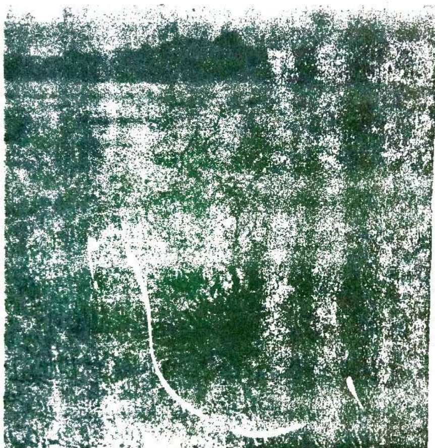
Sl. 4. Asocijacija Salicornietum herbaceae sa primerkom vrste Limonium angustifolium .

Uočene razlike između sastojina, u zavisnosti od ekoloških karakteristika staništa, kao što su period plavljenja, udaljenost od mora, zaslanjenost, itd. ogledaju se, na prvom mestu, u kvantitativnoj zastupljenosti pojedinih vrsta zajednice, a takođe i u florističkom pogledu. Tako, na primjer, suvlja varijanta ove zajednice, koja se razvija na nešto uzdignutijim mestima izvan domašaja plime, u florističkom pogledu bogatija je od hidrofilne varijante, koja se razvija u ekstremnim uslovima plavljenja i velike zaslanjenosti podloge.