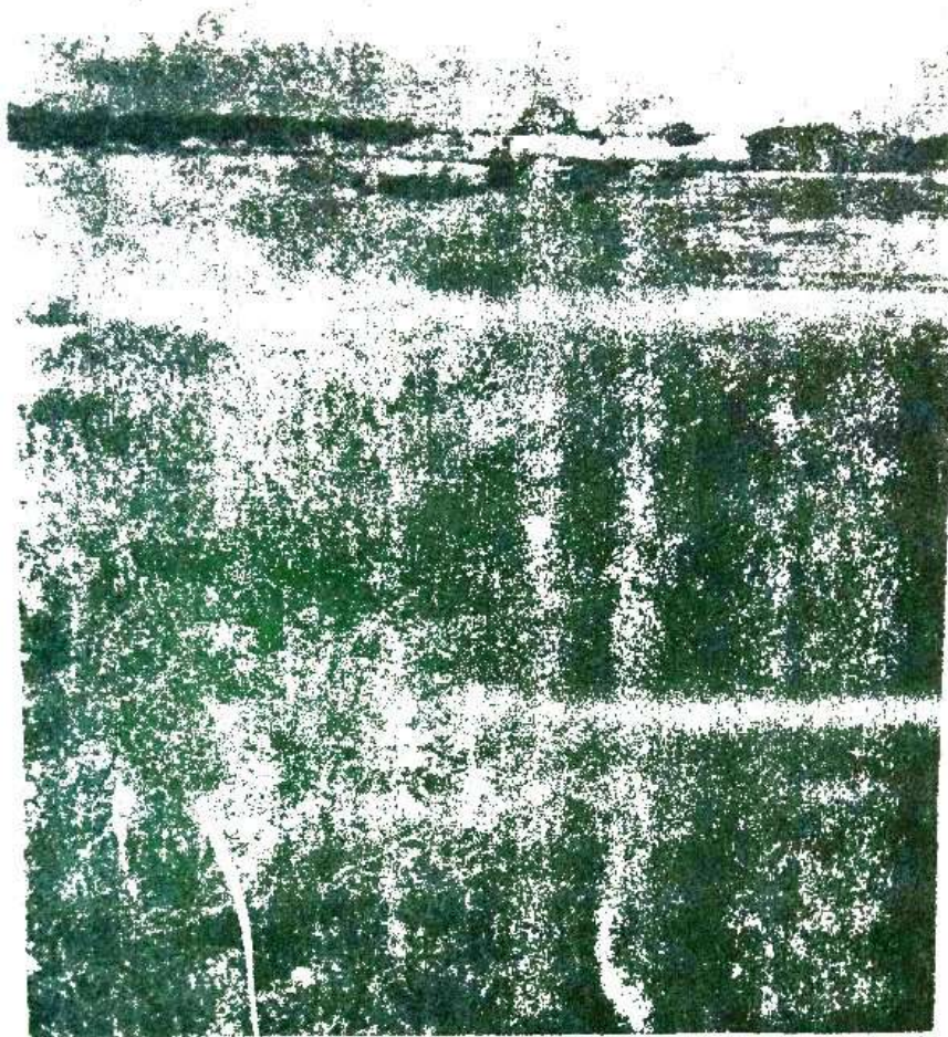
Sl. 3. Sastavina subasocijacije Aeluropetosum litoralis u brakičnim basenima solane.

Floristički sastav zajednice Arthrocnemum fruticosum Br. — B 1. prikazan je u tabeli br. 2. koja je sastavljena iz 25 snimaka. U okviru ove zajednice izdvojena je i jedna nova subasocijacija: aeluropetosum